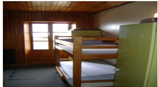
Chambres avec salle d'eau sur palier