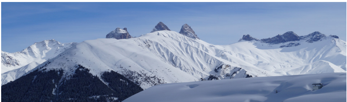
VUE PANORAMIQUE DU CHALET SUR LES SOMMETS EXPOSITION ENSOLEILLÉE PLEIN SUD