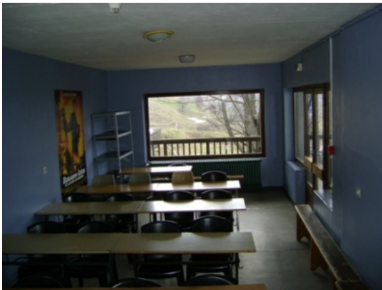
2 salles de classes ou activités