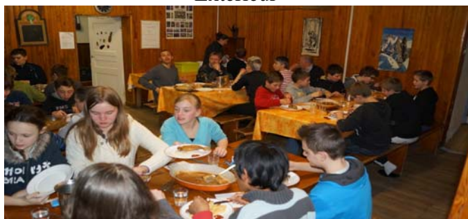
Salle à manger élèves RDC