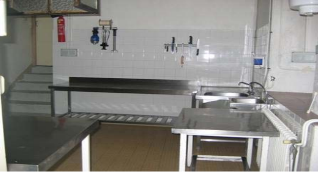
Cuisine préparée sur place