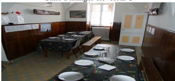
Salle à manger encadrement RDC