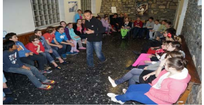
Salle animation RDC