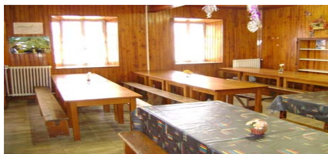
Salle à manger élèves RDC