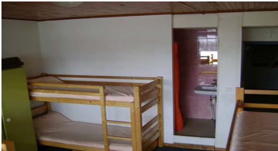
Chambre avec douche ,lavabo