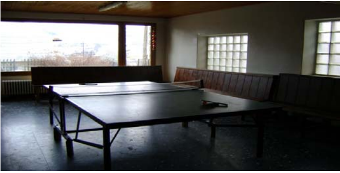
Salle activités RDC